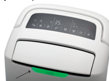
Ukazovatel kvality vzduchu

Kvalita vzduchu je indikována barevným světlem na přední straně jednotky: